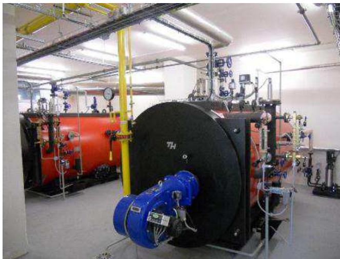
Obr. 1 Parní kotelna