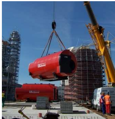
Obr. 2 Stavba kotelny